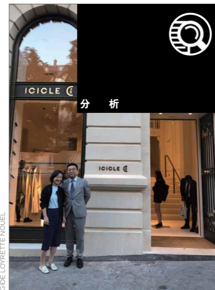
Magasin Phare de la marque ICICLE sur l'Avenue Georges V à Paris 巴黎乔治五世大道上的ICICLE旗舰店