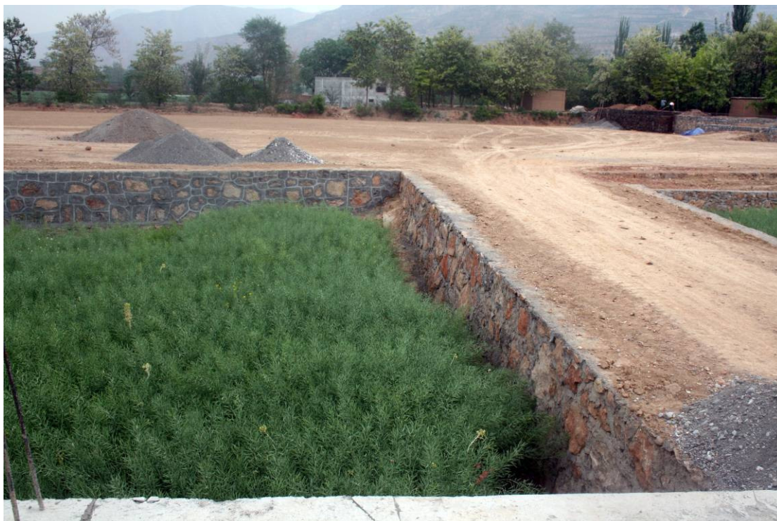
Les fondations sont désormais terminées