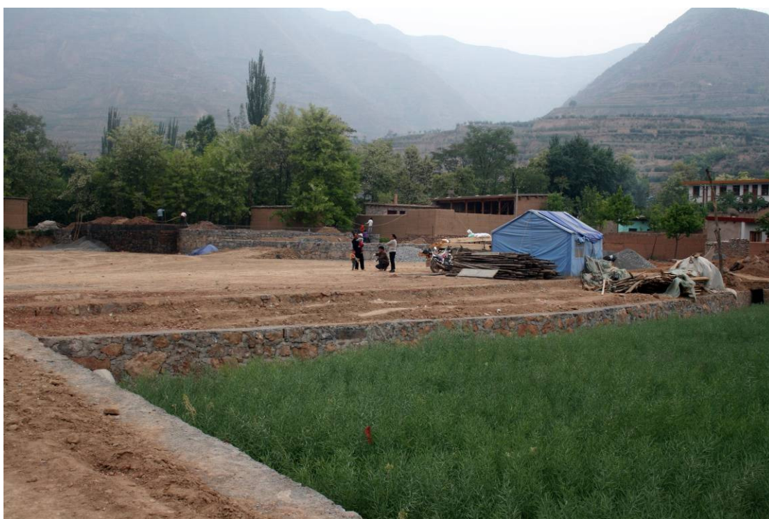
Le processus d'étude sur terrain, design et reconstruction s'effectue de manière optimale. Des organismes de contrôle de qualité des travaux effectuent un suivi régulier.